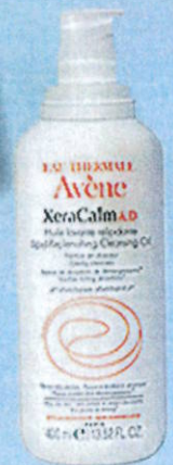
Huile Lavante Relipidante XeraCalm A.D, 400 ml, 17,40 €.