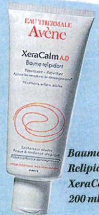
Baume Relipidant XeraCalm A.D, 200 ml, 17,90 €.