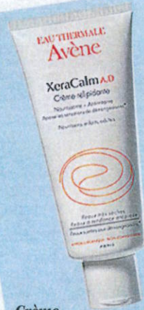
Crème Relipidante XeraCalm A.D, 200 ml, 17,90 €.

C'est la diminution de l'intensité des démangeaisons au bout d'un mois de traitement avec XeraCalm A.D Baume Relipidant. Un record pour les peaux atopiques.